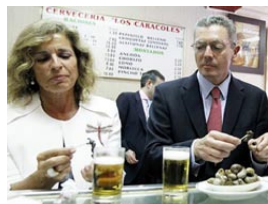
La Alcaldesa y el Ministro desahuciando caracoles